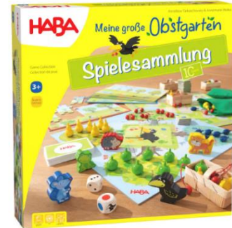
Meine große Obstgarten- Spielesammlung 10 Spiele 1302282001 ab 3 Jahren UVP 59.99 €