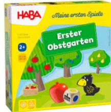
Meine ersten Spiele – Erster Obstgarten 1004655001 ab 2 Jahren UVP 24.99 €