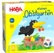
Kleiner Obstgarten, 1004907001 ab 3 Jahren UVP 6.99 €